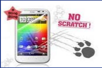
UV抗刮保護 (UV hard coating)